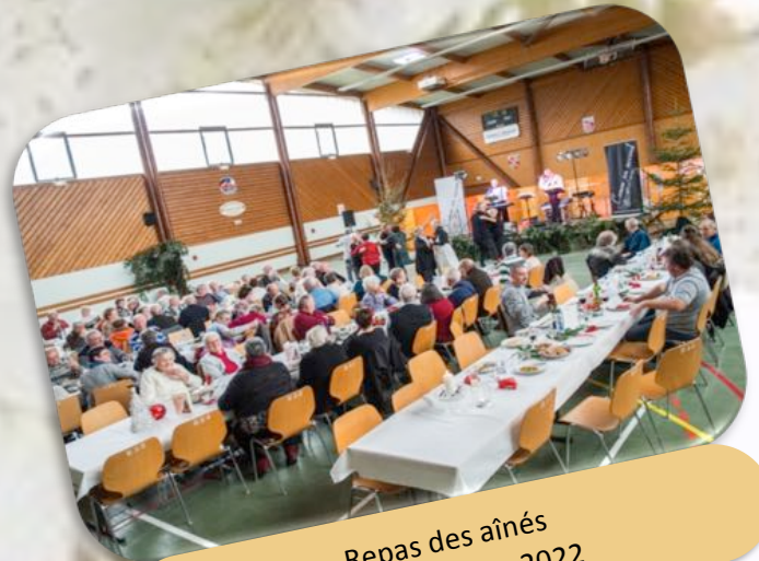
Repas des aînés Le 4 Décembre 2022