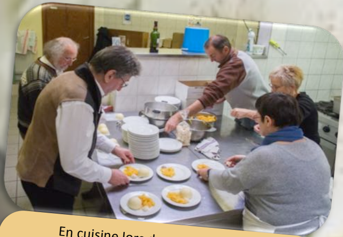
En cuisine lors du repas des aînés Le 4 Décembre 2022