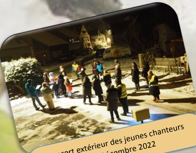
Concert extérieur des jeunes chanteurs Le 17 Décembre 2022