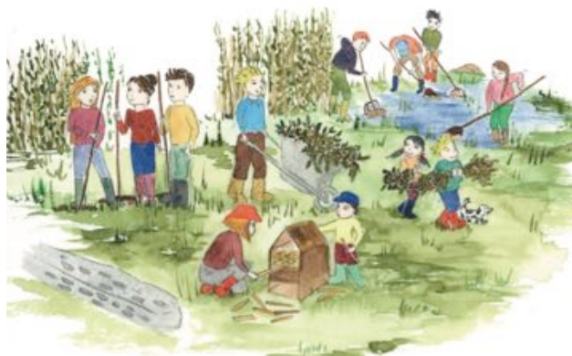
Illustration Sylvia BOUDARD

Après le Messti qui, nous l'espérons nous réunira tous, nous vous proposerons une 1 ère date pour cette journée de travail communautaire.