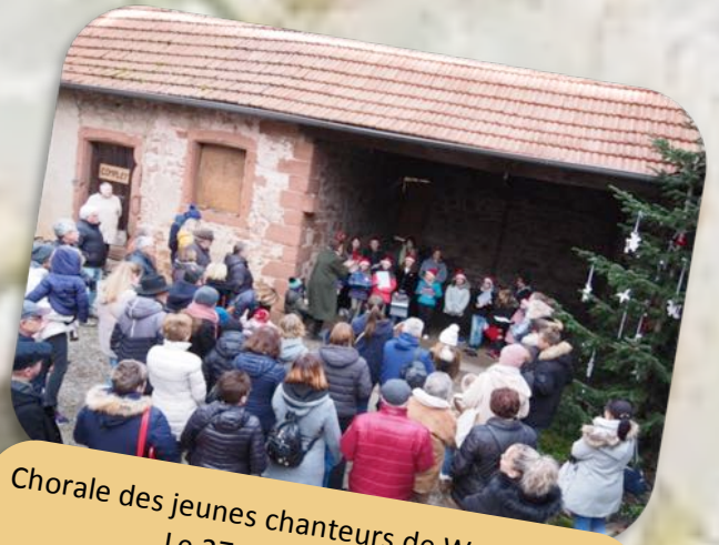
Chorale des jeunes chanteurs de Weiterswiller Le 27 Novembre 2022