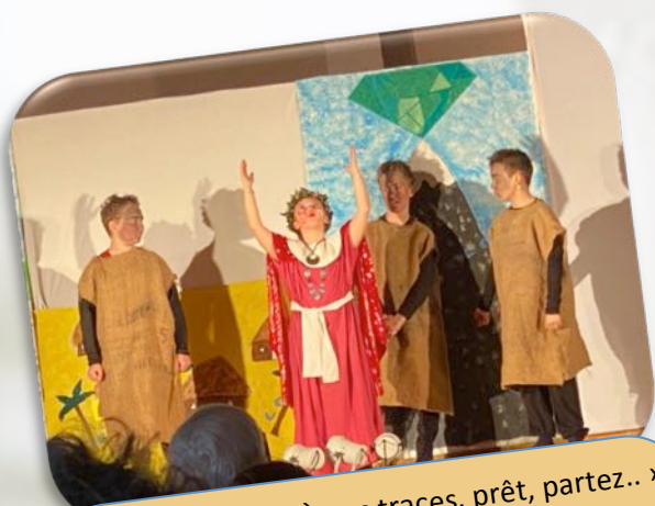
Spectacle école « À vos traces, prêt, partez.. » Le 26 Mars 2023