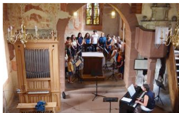
Concert en l'église protestante le 26 Juin 2022

Venez nombreux pour passer cet agréable moment et pour encourager les jeunes chanteurs.