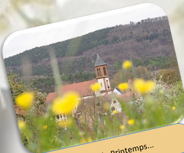
Arrivée du Printemps...