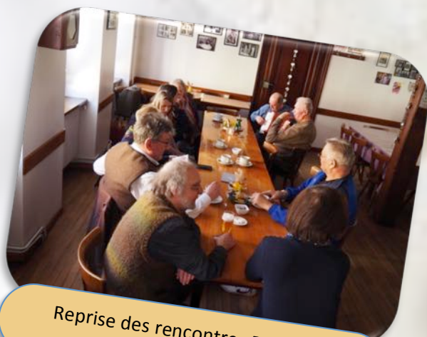
Reprise des rencontres Babelstüb Le 5 Avril 2023