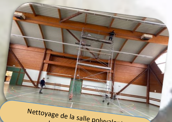
Nettoyage de la salle polyvalente Le 14 Février 2023