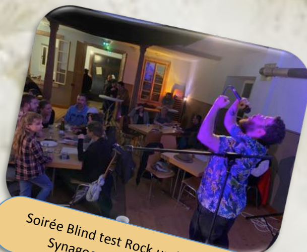
Soirée Blind test Rock und so weiter Synagogue le 1 er Avril 2023