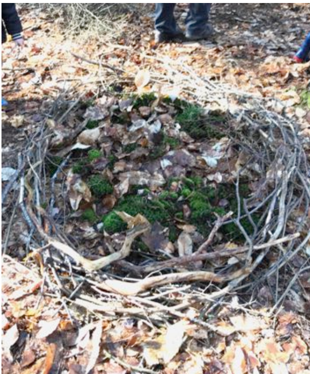
Nid de Pâques