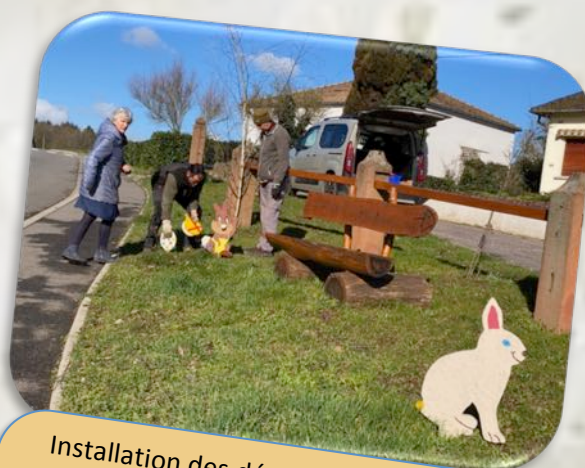
Installation des décorations de Pâques Le 27 Mars 2023