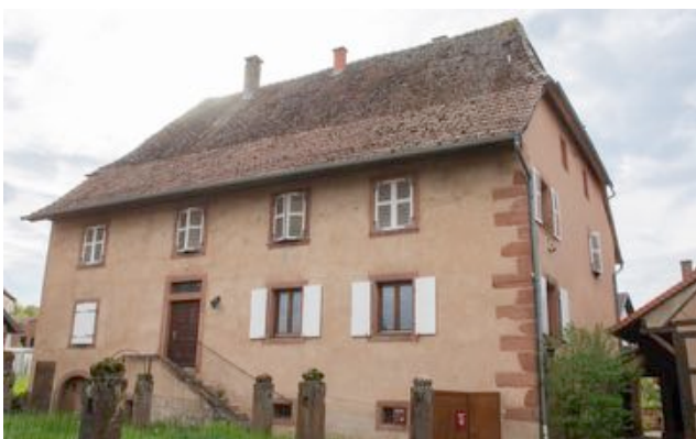
L'ancien logis du bailli (actuel presbytère protestant)

Mais le château, inhabité depuis longtemps commence à se ruiner et, bientôt, il servira de carrière de pierres prêtes à l'emploi. Des matériaux du logis seigneurial seront réemployés à partir de 1737 pour construire l'hospice des franciscains à Neuwiller ainsi que des maisons du village. Ils achèveront d'être dispersés sous la Révolution.