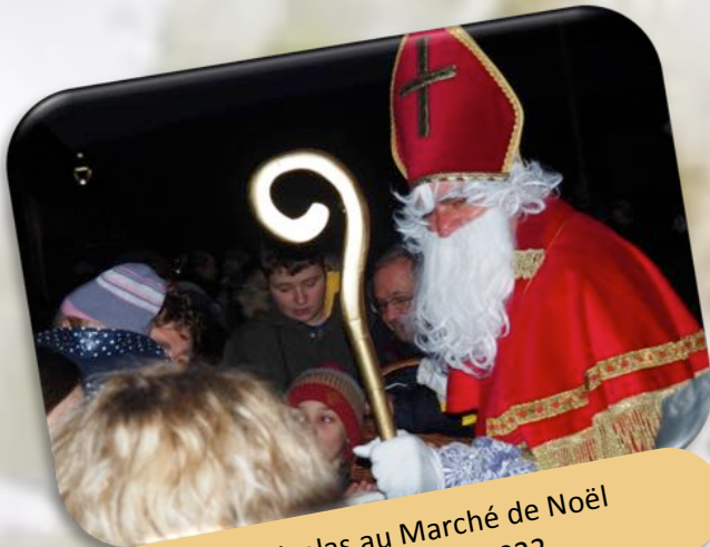
Saint Nicolas au Marché de Noël Le 27 Novembre 2022