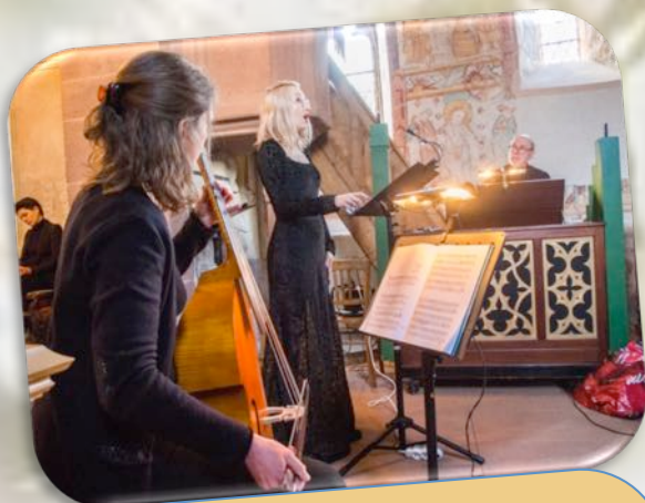
Concert de l'ensemble « Hortus Musicalis » à l'église historique Le 19 Mars 2023