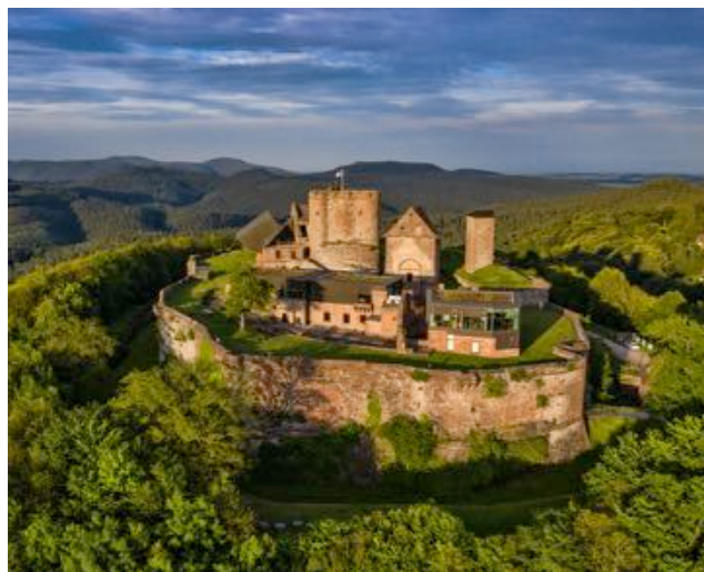
Photo aérienne du château de Lichtenberg

La ComCom semble avoir mesuré le gisement que constitue le tourisme (**) et sans doute mettra-t-elle les moyens pour aider à la création des