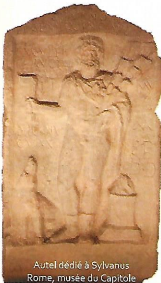
Autel dédié à Sylvanus Rome, musée du Capitole

A Weiterswiller, ils édifièrent – probablement au Zollstock – un temple, le Schwarze Tempel , dédié à Sylvain (ou Sylvanus ), dieu des forêts. Ce temple païen fut sûrement transformé en chapelle lors de la