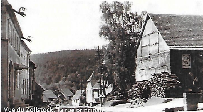
Vue du Zollstock, la rue principale dans la première moitié du XXe siècle

Ne voyez dans mon propos aucune nostalgie ni, surtout, aucun jugement de valeur ; je veux simplement constater par là combien notre façon de vivre a fondamentalement