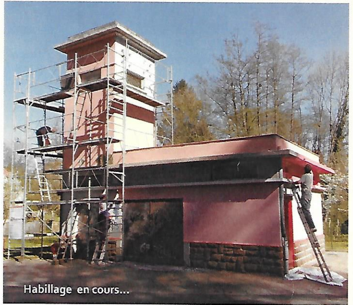
Habillage en cours...

L'emploi par Franck Bragigand d'une palette de nuances du rouge de Weiterswiller lui a non seulement permis de mettre en valeur les volumes et reliefs de ce bâtiment anguleux, mais également de garantir à son architecture typique des années 60 une intégration visuelle désormais harmonieuse au tissu de bâtis traditionnels du quartier de